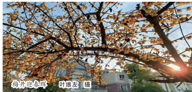
梅开迎春晖

龙抬头，不只是一个节日，更是一种精神的寄托，它让我们在忙碌的生活中，不忘传承古老的文化，感受岁月的馈赠。在这个特殊的日子，我们带着希望与勇气，踏上新的征程，去拥抱生活的美好，去书写属于自己的精彩篇章。让我们在龙抬头的这一天，与春日一同苏醒，向着未来，奋力前行。